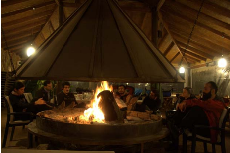
Solda: Yemek Sonrası Keyfi