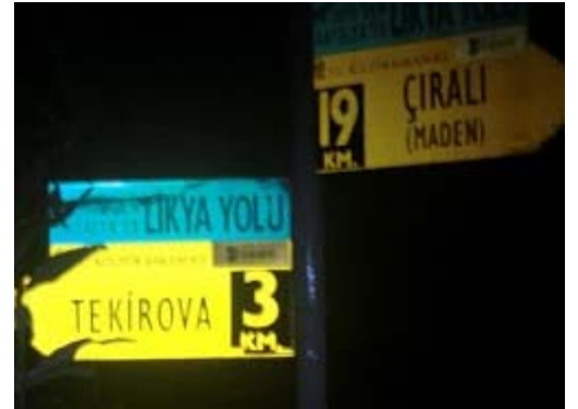
Görünce En Çok Sevinilen Tabela

Yolun bu kısmından sonrası hepimiz için oldukça acılı ve sırlıklam. Yağmur gittikçe artan şiddetle yağarken, biz bir tırmanıp bir inerek kocaman burunları aşılıyorz (Aslında max 90 m.:)). Kaç tane aşık hatırlamıyorum; ha bunu aşınca Tekirova, ha şunu aşınca Tekirova derken ben ve dizlerim gerçekten kendimizde değildik pek=) Bana kalsa, mavi işarete geri dönüp doğru yola girdikten sonra gördüğümüz ilk koyda kamp atardık☺. Bu noktadan sonra 3 saat kadar daha yürüyoruz ve bu sonuncu günde, ilk iki günde yürüdüğümüz yolun toplamından daha fazlasını yürüyerek kendi çapımızda bir rekor kırmış oluyoruz. ☺