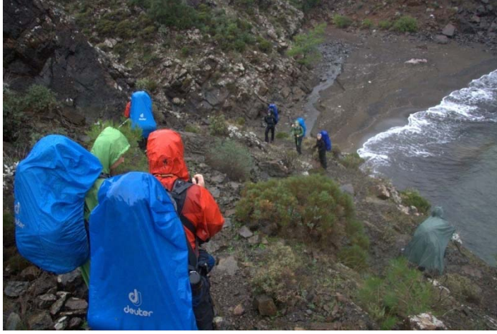
Yol Üzerindeki Koylardan Birine İnerken

verseydik, hem manzaranın güzelliğini kaçırarak, hem dar patikada karanlıkta yürümekte zorlanacak hem de yarım saat uzakta sandığımız hedefe bir türlü varamadığımız için moralimiz bozulacaktı. Ne iyi etmişiz gündüzü beklemekle diyoruz. Elimizdeki rehber kitapta yürüyen kişi, kamp yükü olmaksızın yürüdüğü için süre-mesafe tarifleri bizimkiyle pek örtüşmüyor. (Bu uyuşmazlığı rotanın başka noktalarında da tespit ettiğimiz için paylaşıyorum.)