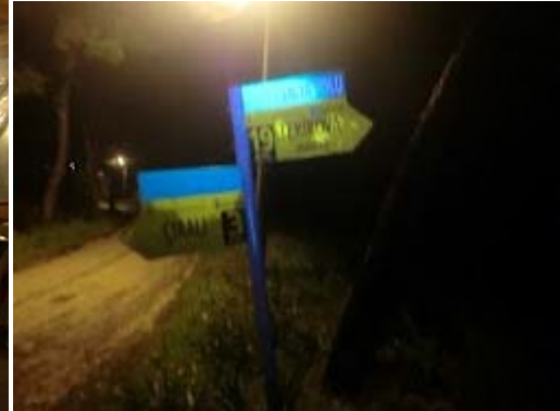
Altta: Kamp Yaptığımız Yerde Bulunan Yol Tabelaları