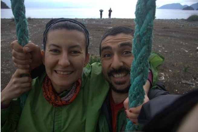
Maden Koyu Hatırası

Moladan sonra 15 dakikalık mesafede Maden Koyu'na varıyoruz ve burada kısa bir fotoğraf molası veriyoruz.