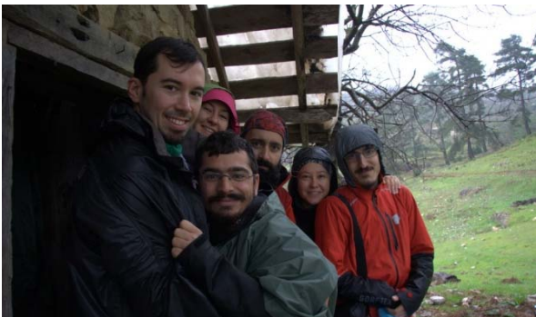
Çobanın Kulübesinin Önünde Yürümeye Hazırız

30.12.2012 Pazar sabahı planlanandan yarım saat gecikmeli olarak 10:30'da, yine hafifçe çiseleyen yağmur altında çadırları toplamış ve yürüyüşe başlamıştık. Hem bir önceki akşam, hem de o sabah yağmur gerçekten çadır kurmak ve toplamak için bize avans vermişti. Yürüyüşe hafif yağmur altında başladık ve gökyüzü, gün boyu bir duran bir hafifçe ıslatan yağışla bize fazla zorluk çıkarmayacak şekilde eşlik etti. Önceki gün tırmanmış olduğumuzdan daha dik bir eğimle inişe geçtik. Çıkarken karşılaştığımız devrilmiş kütüklerden daha çoğu inişte de karşımıza çıktı. Altından-üstünden bir şekilde geçip kütüklerden kurtulduk. Yürümeyi oldukça yavaşlattılar maalesef.