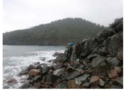
Kayaların Üzerinde Yanlış Yerde Yol Ararken